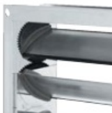
Zabudowane koła zębate