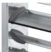
Boczne uszczelnienie z zamkniętokomórkowego materiału